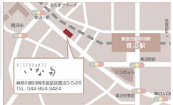
◇東急田園都市線 鷺沼駅より徒歩5分(渋谷から急行で17分)